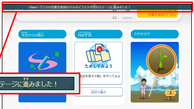
▲児童生徒トップ画面

※画像は開発中のものです。予告なく変更になる場合がありますので、ご了承ください。