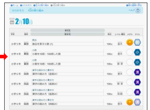
▲児童生徒>1日の取り組み