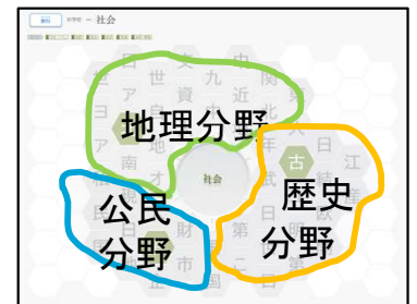
▲タイルマップ学習 中学社会