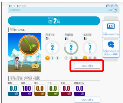
▲児童生徒>ふりかえり