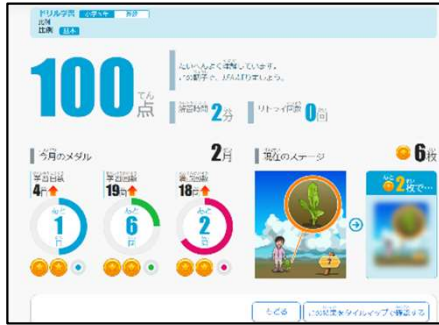
▲児童生徒>ドリル採点後