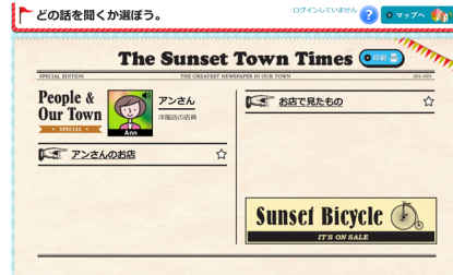
ストーリーを選ぶ